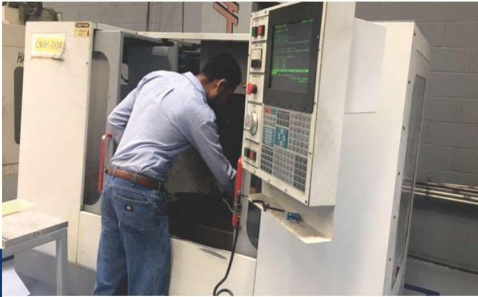
5 CENTROS DE MAQUINADO