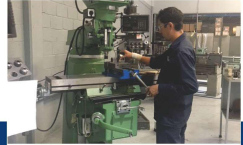
4 FRESADORAS CONVENCIONALES