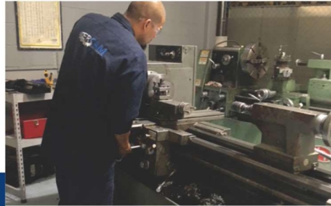
3 TORNOS CONVENCIONALES