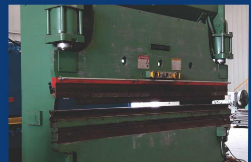
DOBLADORA DE LÁMINA