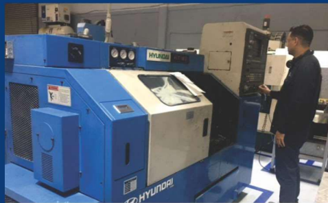
3 TORNOS CNC