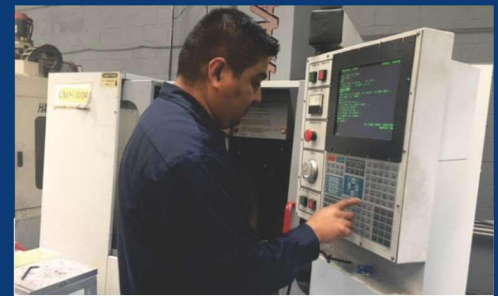
4 CENTROS CNC