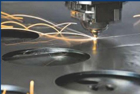
CORTADORA LASER TOLERANCIA \pm 0.05 MM